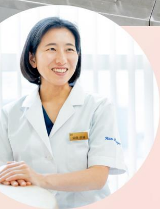
BiOSTYLE CLINIC 院長